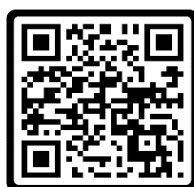
เล่มแผนฯ สพจ.

ข้อสั่งการ : ขอให้สำนักงานพัฒนาชุมชนอำเภอทุกแห่งได้เตรียมความพร้อมในการ ยกร่างแผนพัฒนาชุมชนเชิงพื้นที่ของสำนักงานพัฒนาชุมชนอำเภอ ซึ่งจะต้องดำเนินการ ในปีงบประมาณ พ.ศ. ๒๕๖๙ โดยสามารถศึกษาแนวทาง/วิธีการจากเอกสารตาม QR CODE ด้านล่างนี้